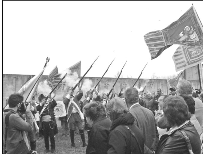
Ultimo saluto della folla e tributo d'onore della Milizia Veneta

Oggi riposa nel cimitero di S. Martino delle Badesse.